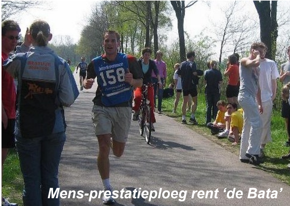
Mens-prestatieploeg rent 'de Bata'

Nou, daar zit ik dan: beentjes omhoog, bakje koffie. Lekker bij te komen van een rondje rennen langs de Amstel. Als ik zo zit bij te komen drijft mijn gedachte vaak terug naar dat heroïsche evenement van afgelopen April. De Batavierenrace.